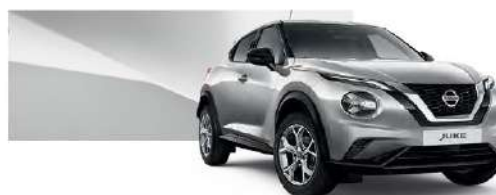
Srebrny - KYO