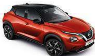
Czerwony Fuji Sunset + Czarny dach - XEY Personalizacja wnętrza N-Design B