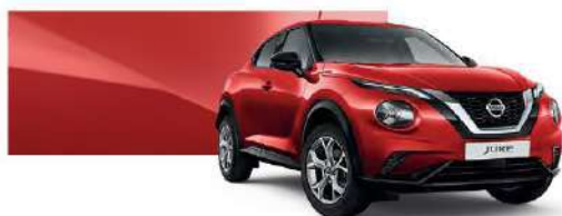
Czerwony - Z10