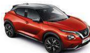
Czerwony Fuji Sunset + Srebrny dach - XEZ