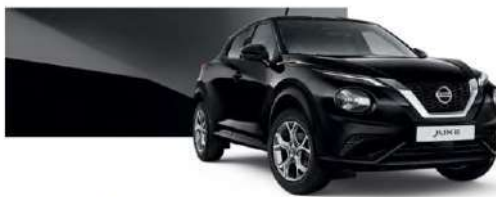
Czarny - Z11