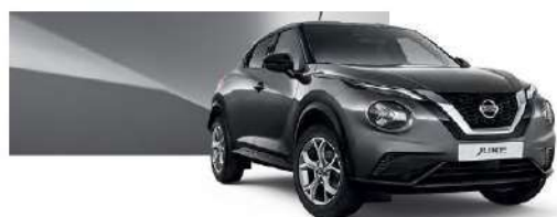
Szary - KAD

Lakier metalizowany / premium – 2.400 zł