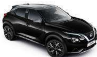
Czarny + Srebrny dach - XDZ Personalizacja wnętrza N-Design B