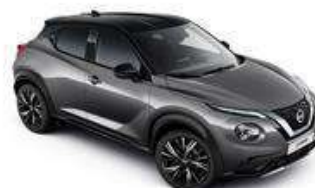
Szary + Czarny dach - XDJ Personalizacja wnętrza N-Design W, B, R