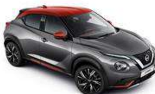
Szary + Czerwony Fuji Sunset dach - XFB Personalizacja wnętrza N-Design B