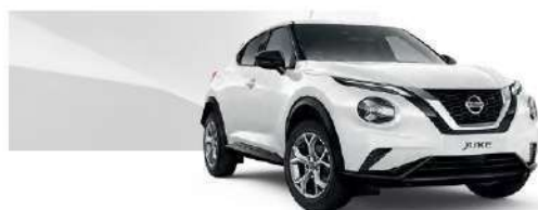
Biały - 326

Lakier metalizowany / premium – 2.400 zł