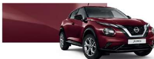
Burgundowy - NBQ