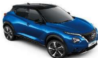
Niebieski + Czarny dach - XFV Personalizacja wnętrza N-Design B