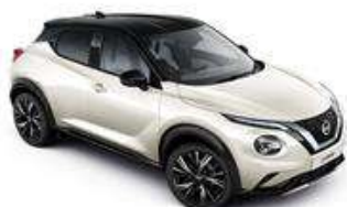
Biały perłowy + Czarny dach - XDF Personalizacja wnętrza N-Design W, B