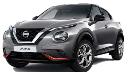
Miejski pakiet pomarańczowy