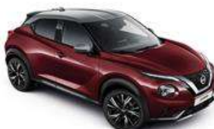
Burgundowy + Srebrny dach - XEE Personalizacja wnętrza N-Design B