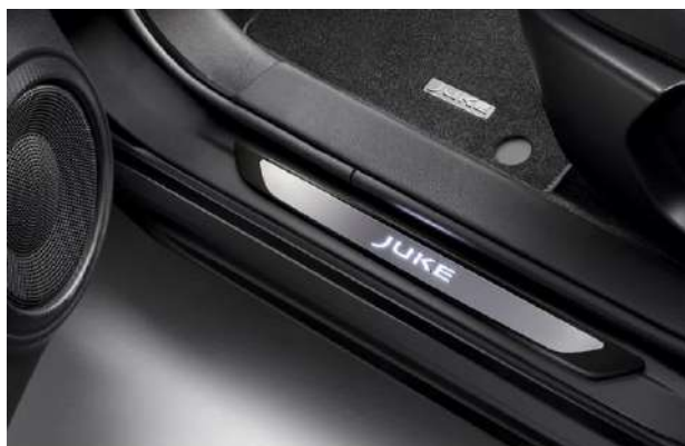
Podświetlane nakładki progów