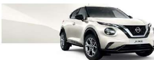
Biały perłowy - QAB