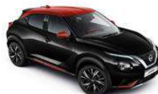
Czarny + Czerwony Fuji Sunset dach - XFC Personalizacja wnętrza N-Design B, R