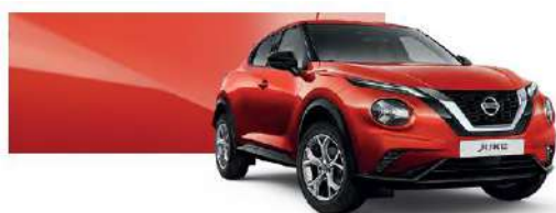
Czerwony Fuji Sunset - NBV