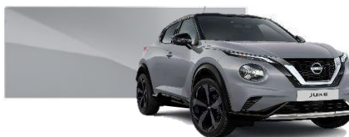
Szary ceramiczny - KBY