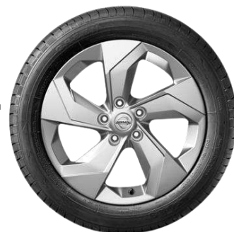
17" srebrna felga aluminiowa