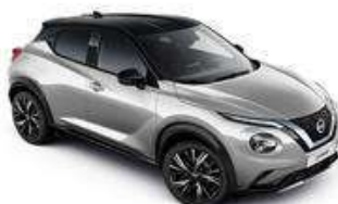
Srebrny + Czarny dach - XDR Personalizacja wnętrza N-Design B