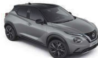
Szary ceramiczny + Czarny dach - XFU Personalizacja wnętrza N-Design B

Dostępne 3 opcje personalizacji wnętrza dla wersji N-Design: