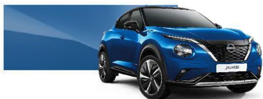
Niebieski - RCF