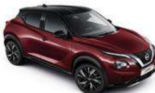
Burgundowy + Czarny dach - XDX Personalizacja wnętrza N-Design B